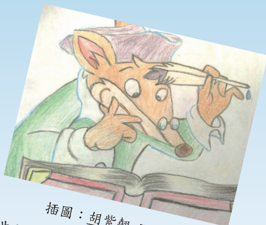
插圖： 胡紫翹 5D