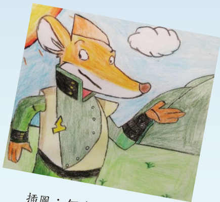
插圖： 何家熙 5B

假如我有超能力， 我會讓自己變成行政長官， 令 香港 的經濟變好， 增添更多社會津貼， 並把津貼發放給有需要的人。