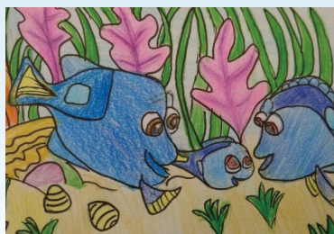
插圖： 伍珈瑩 5A