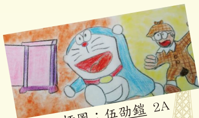
插圖： 伍劭鎧 2A

這晚，我就好好地反省過，無論他待我如何，他始終也不是陌生人，因為他一出生就是我最親的親人。